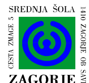
SREDNJA ŠOLA 1410 ZAGORJE OB SAVI CESTA ZAMGE 5 ZAGORJE